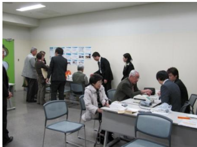
血圧計の簡易チェック

講演後は、血圧計の正しい測定方法を体験して頂き、臨床工学技士による自動血圧計簡易チェックおよび保守に関する相談も併せて実施しました。